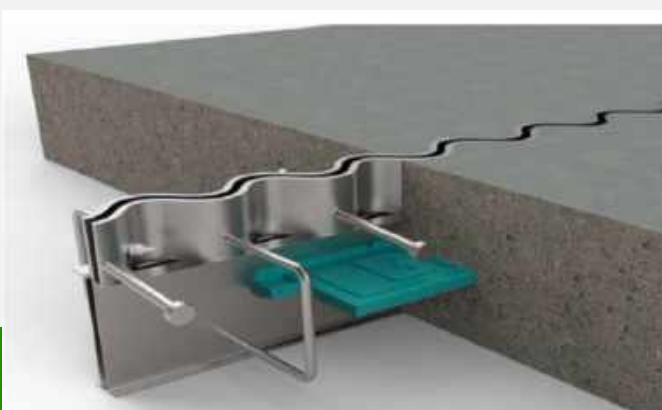
JUNTA TIPO S