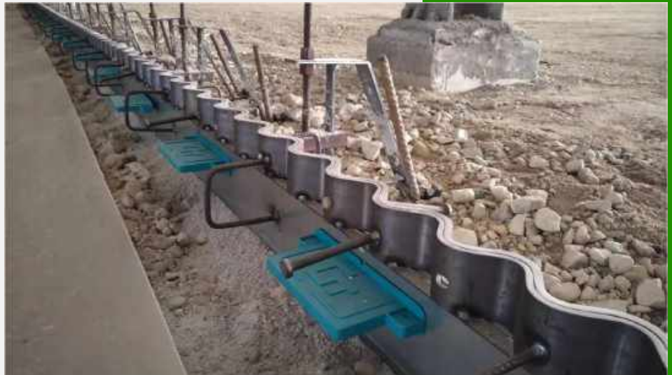
JUNTA TIPO S